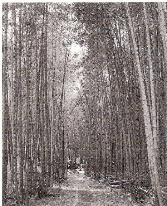
伐採前の竹林風景